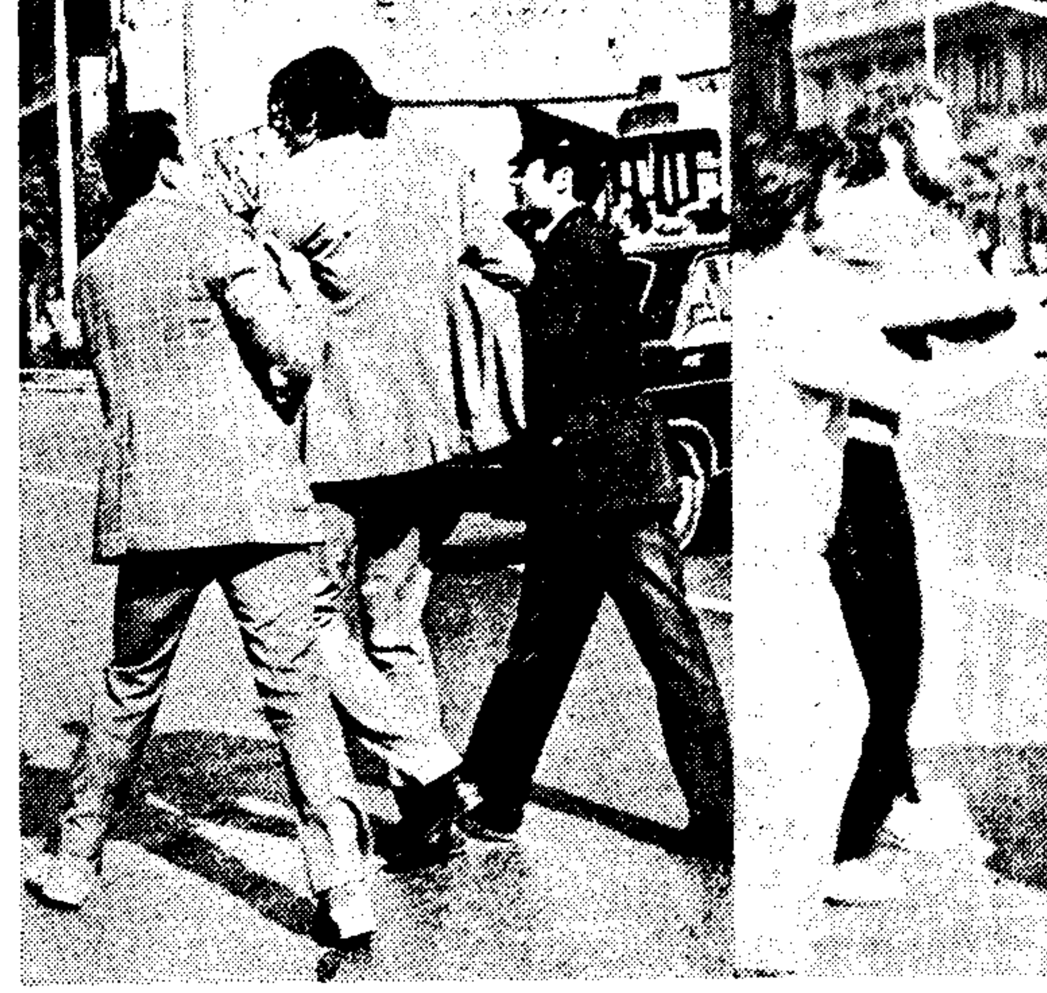
Σκηνές από τη σύλληψη και απέλευση συλληφθέντων διαδηλωτών από διερχόμενους πολίτες, μπροστά από το ξενοδοχείο της «Μαγιάς Βρετανίας».