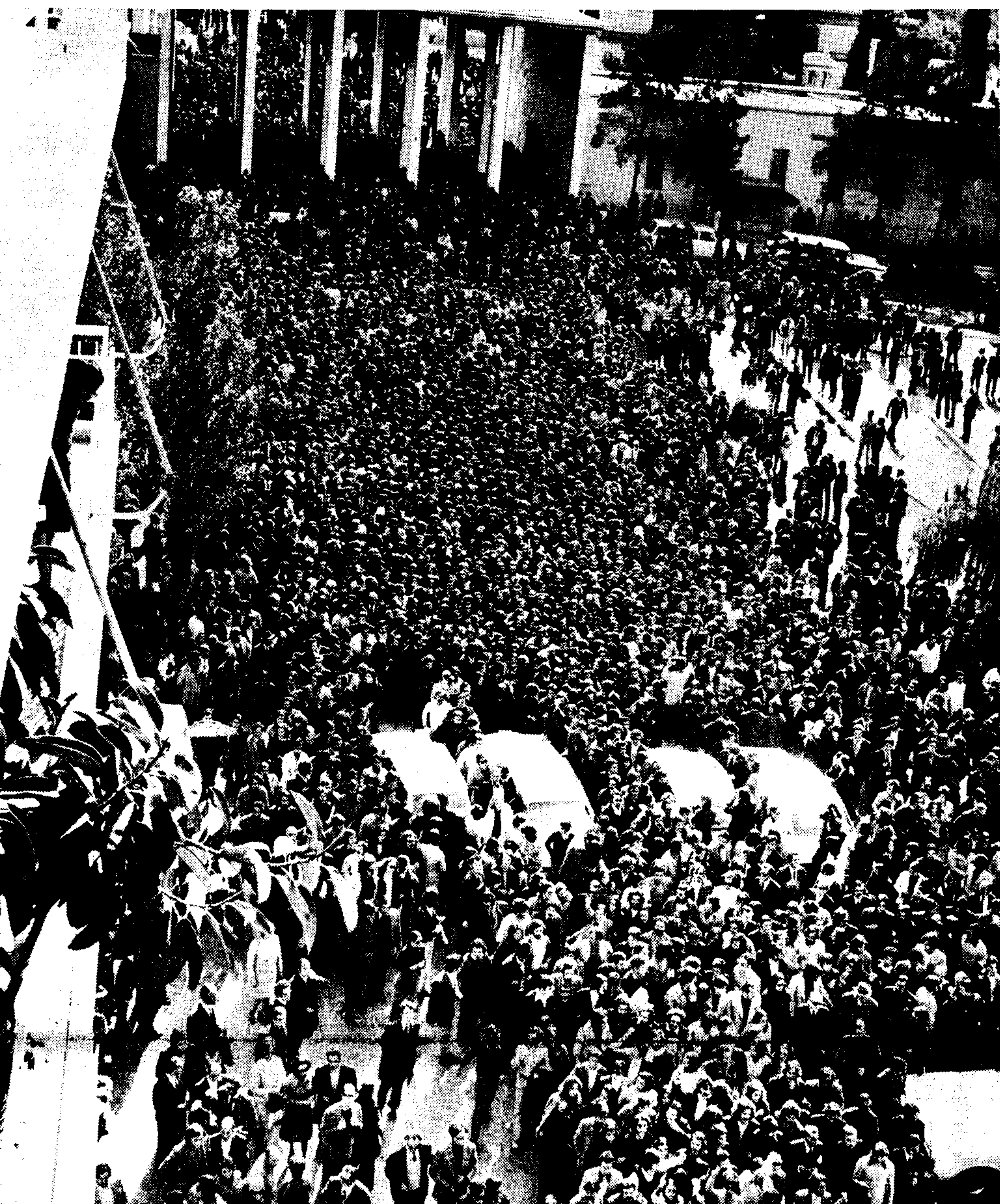
Χιλιάδες λαού κατέκλυαν χθες το πρωί την περιοχή του Α' Νεκροταφείου όπου έγινε το μνημόσυνο του Γεωργίου Παπανδρέου...